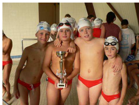
L'équipe Poussin Garçons L'équipe Poussin Filles